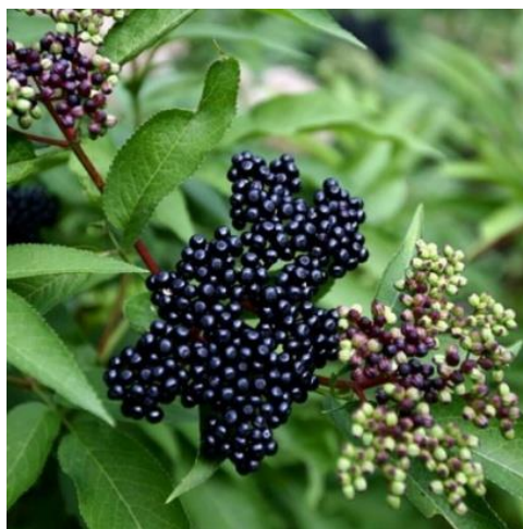
Рис.1. Внешний вид ягод бузины

Рассматриваемые в настоящей работе плоды бузины представляют собой фиолетовые ягоды диаметром 6 мм, содержащие 2–4 косточки. Отличаются кислым вкусом и железной консистенцией.