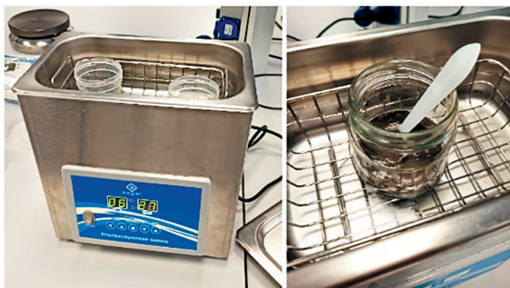
Рис. 3. Обработка образцов в ультразвуковой ванне

Затем проводили щелочную экстракцию и осаждение белка при тех же условиях, что и в контрольном измерении. Содержание сырого протеина на абсолютно сухое вещество в полученной белковой пасте составило 93,66%, то есть на 8,23% больше, чем в контрольном измерении.