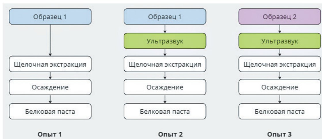
Рис. 2. Схема экспериментов

количество белка в растворе выходит на плато и при увеличении времени остается на том же уровне. Исходя из этого, время обработки ультразвуковым излучением в данном исследовании было выбрано равным 15 минутам. Частота ультразвука составляла 20 и 28 кГц, при этом с повышением частоты повышался выход белка. В данном исследовании было использовано оборудование с частотой ультразвука 40 кГц. Следует учесть, что использованное оборудование представляло собой соноотрод – излучатель ультразвука, который погружают в раствор, а в данном исследовании была использована ультразвуковая ванна. Схема проведенных экспериментов представлена на рисунке 2.