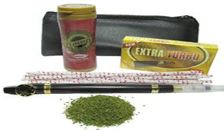
Рис. 3. Медвах – курительная трубка для Дохи

Параллельно проводилось исследование возможности использования табака Доха для изготовления табака для кальяна. Доха – один из видов высоконикотинового сырья, известного в России, которое выращивают в ОАЭ в оазисе Хатта на территории горного массива в Рас-Аль-Хайма [3]. Традиционно Доху потребляют с помощью трубки «медвах», что в переводе с арабского означает «головокружение».