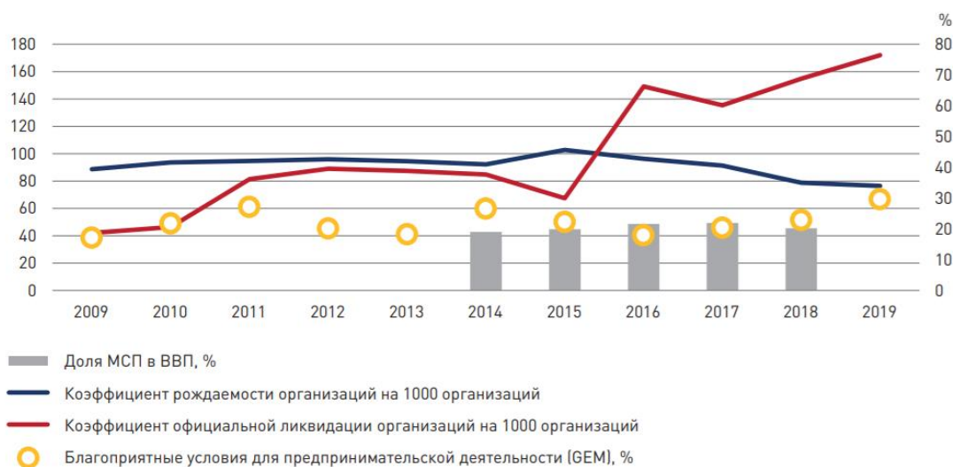
Рис. 1. Показатели развития сектора МСП и оценка населением благоприятных условий для предпринимательской деятельности, 2009–2019 гг. [2]